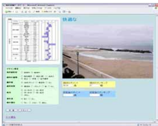
図 3 設計検討画面

海岸景観写真一覧より選んだ写真に対して感性ワードを選択すると、図-3に示す設計検討画面が表示される。ここでは、写真 No.3 の「快適な」を例に上げる。画面左側上には、現状の海岸景観のデザイン要素、これは表-1に示すアイテム・カテゴリーから心理要素を抜いたものである。