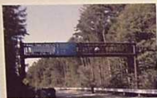
ハヶ岳公園ライン(山梨県北杜市)上の 既設ヤマネブリッジ