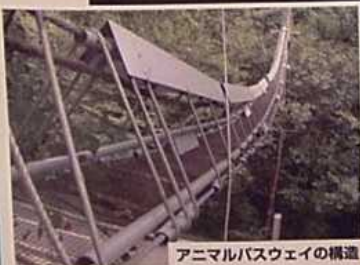
アニマルパスウェイの構造