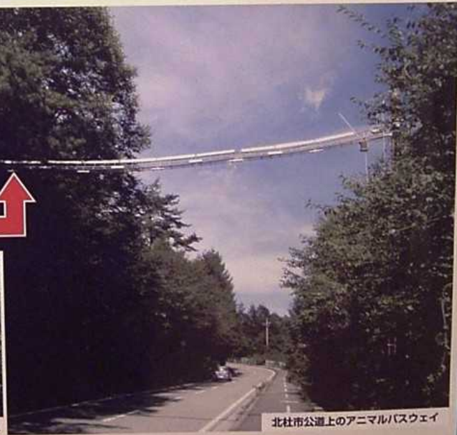
北杜市公道上のアニマルパスウェイ