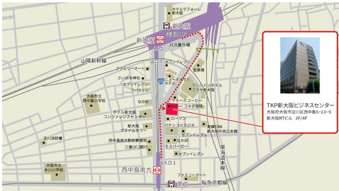
TKP 新大阪ビジネスセンター 位置図